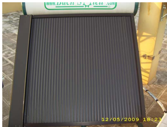
MODELLO COMPACT E/O NATURALE